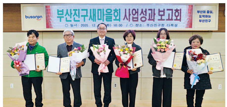
부산진구의회는 12월 30일 다복실에서 열린 ‘2025년도 부산진구 새마을운동 사업성과보고회’에 함께 했다.