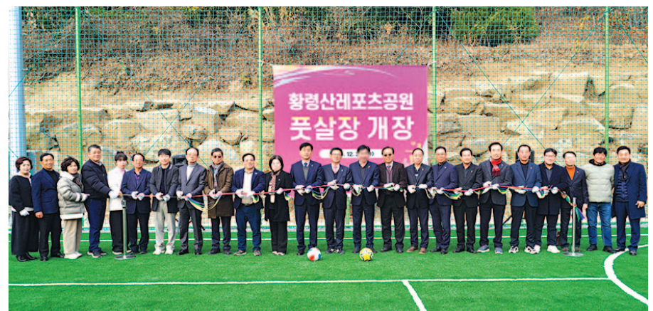
부산진구의회는 12월 23일 황령산레포츠공원에서 열린 ‘황령산레포츠공원 풋살장 개장식’에 함께 했다.