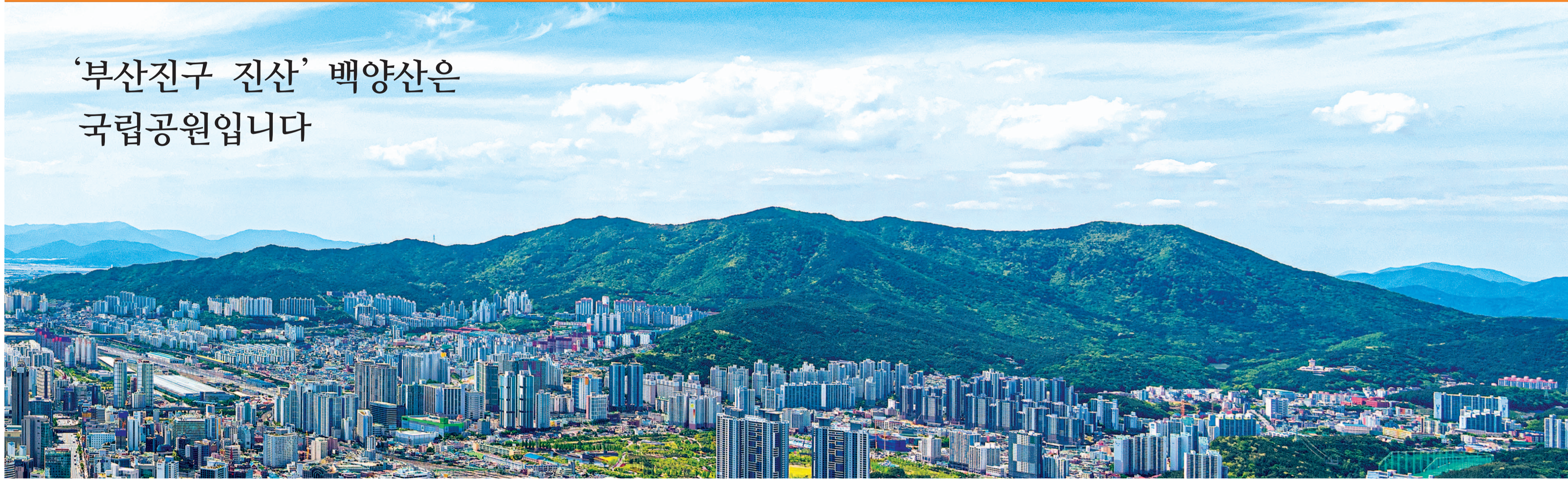
‘부산진구의 진산’인 백양산(해발 642m)이 3월 3일부터 공식적인 국립공원으로 승격했다. 사진은 부산진구를 감싸고 있는 백양산 주능선의 모습.