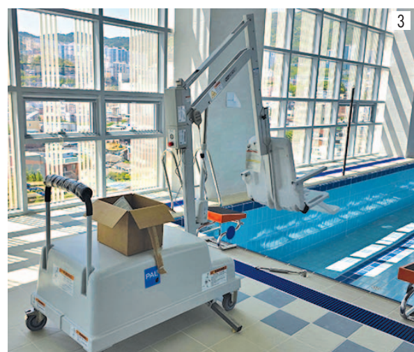
① 당감국민체육센터 외관 전경 ② 당감국민체육센터 6층에 설치된 수영장. 6레인 중 1개 레인은 장애인 전용이다. ③ 수영장에 완비된 장애인용 리프트